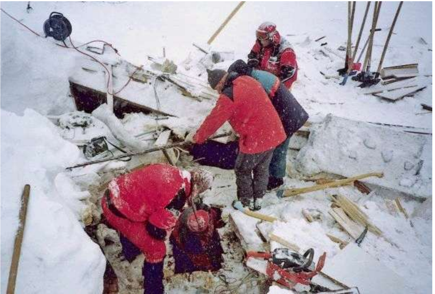
Die Rettungskräfte suchen stundenlang nach den zwei Verschütteten.

Nach mehrstündiger Suche fanden die Hilfskräfte den Schrunser gegen 20 Uhr, begraben unter drei Metern Schnee. „Es war ein Wunder, dass er noch lebte. Wir waren erleichtert und gaben den bewusstlosen Mann in die Obhut des Notarztes. Leider verstarb er dann später aber doch noch.“ Etwa eine Stunde später entdeckten die Retter auch die Ungarin. Auch für diese kam jede Hilfe zu spät. Sie konnte nur noch tot geborgen werden.