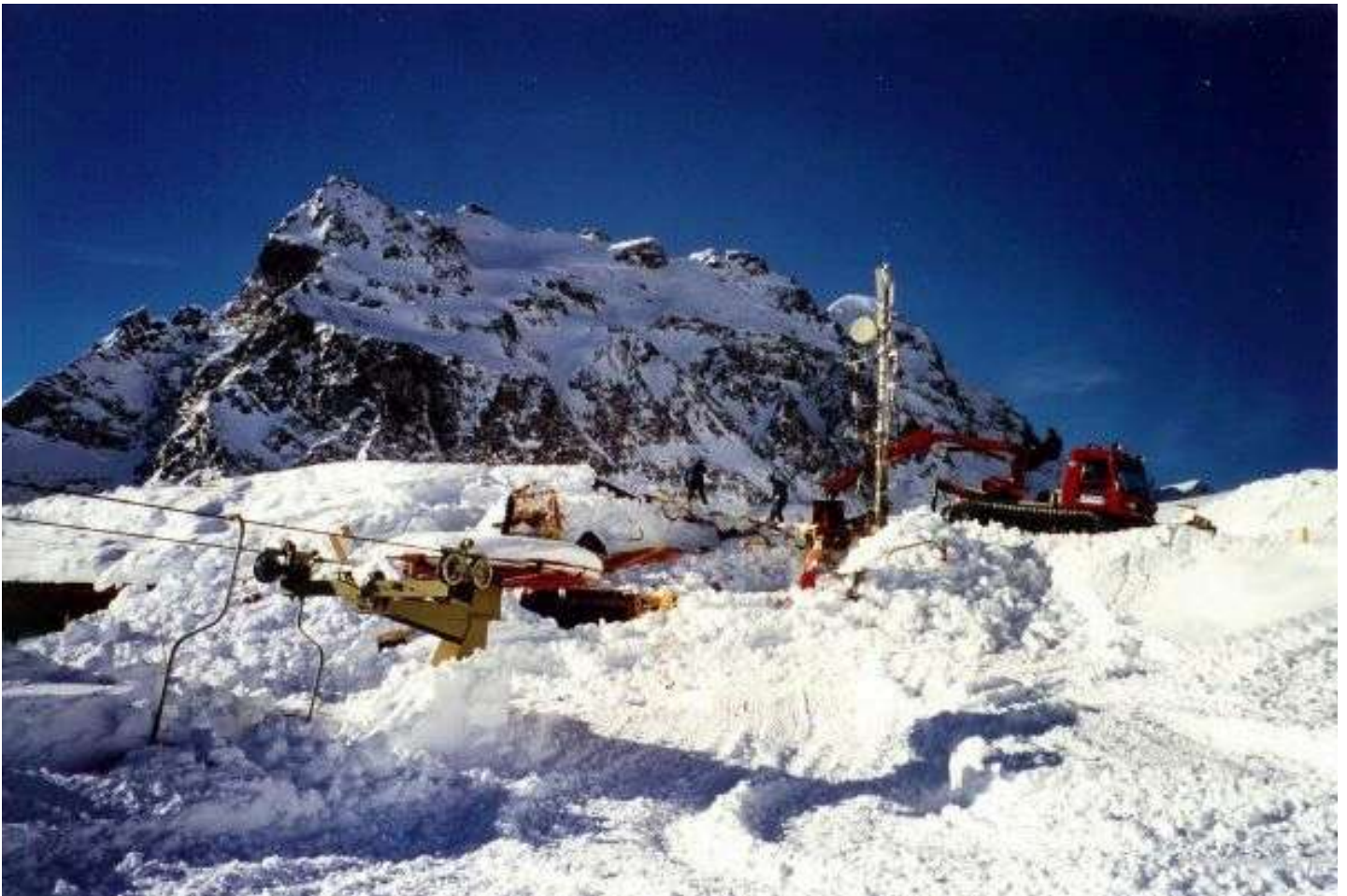
Die Lawine am Schafberg zerstörte auch die Bergstation des Doppelsesselliftes. HELMUT BACHMANN

und zehn Meter hohe Staublawine talwärts. Die Schneemassen begraben große Teile des Wintersportorts unter sich. 31 Menschen verlieren dabei ihr Leben.